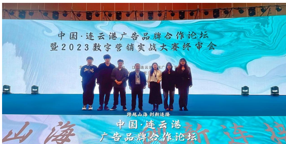
学生参与广告品牌合作论坛校外实训