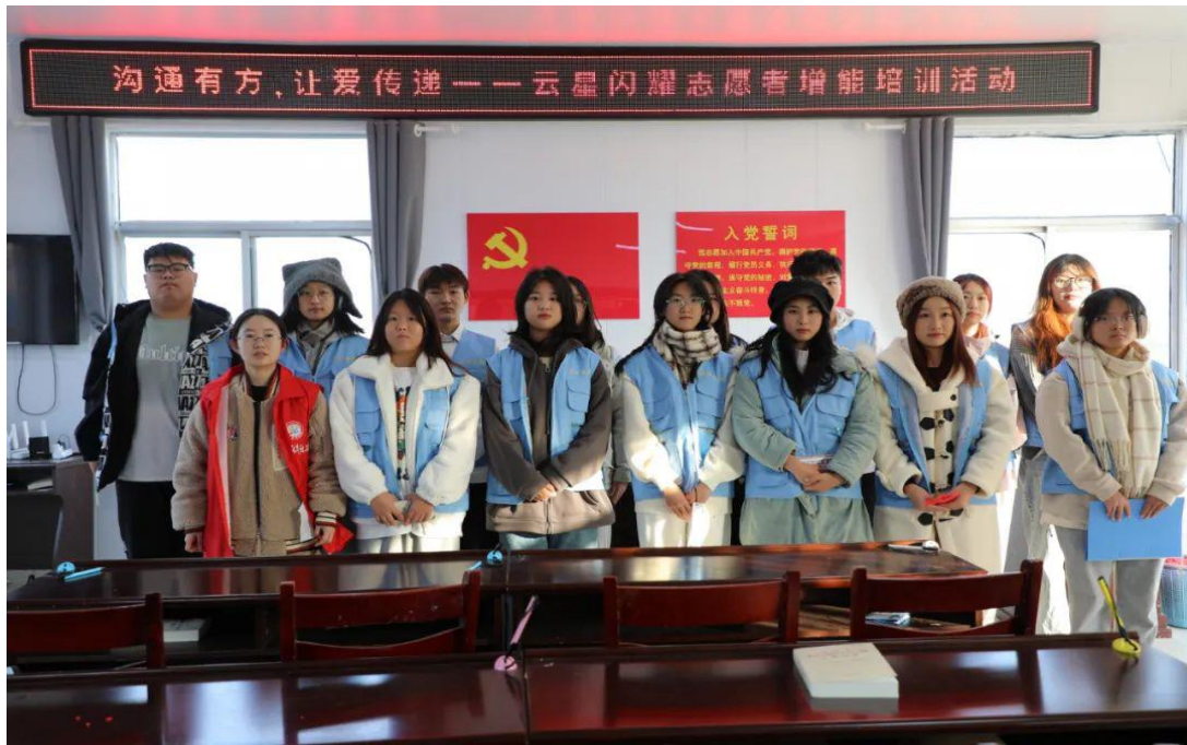
学院开展“沟通有方，让爱传递”志愿服务活动