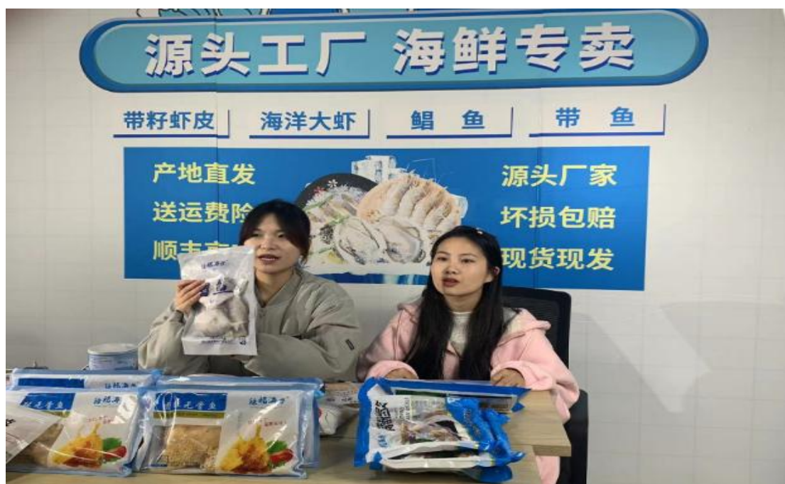
学生参加连云港农业农村局助农直播

培养融媒体行业相关人才、服务地方发展的任务。学院学生通过实践锻炼，提升自身综合素质，做到学以致用。