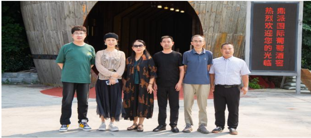
学院老师调研江苏鼎派酒业有限公司

促进产教融合、校企“双元”育人，坚持知行合一、工学结合，积极利用企业资本、技术、知识、设施、设备和管理等要素参与校企合作和人才培养，校企共赢。发挥校企互动合作，产教融合的作用，实现职业教育与岗位需求的“零对接”，办没有围墙的大学。学院发挥企业资源优势，与一些企业开展深度合作，前期学院先后调研了近20家企业，已与连云港当地江苏筋斗云供应链管理有限公司、连云港妮佳影视文化传媒有限公司、江苏鼎派酒业有限公司3家企业已经拟定合作协议。