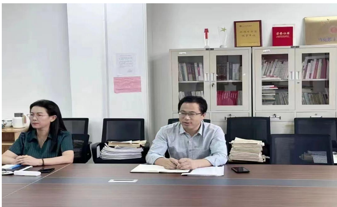
召开师德师风教育会议

立德树人，积极推进“双师型”教师队伍建设。坚持把师德师风建设放在第一位。教师必须能够坚定不移贯彻党的教育方针、热爱职业教育事业、落实立德树人根本任务，以德立身，关爱学生。发现违反师德师风行为的，发现一起，严肃处理一起。