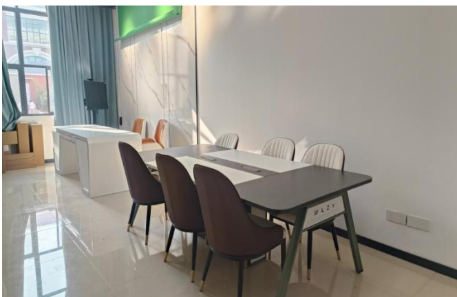
新媒体运营工作室

促进产教融合、校企“双元”育人，坚持知行合一、工学结合，积极利用企业资本、技术、知识、设施、设备和管理等要素参与校企合作和人才培养，校企共赢。发挥校企互动合作，产教融合的作用，实现职业教育与岗位需求的“零对接”，办没有围墙的大学。学院发挥企业资源优势，与一些企业开展深度合作，前期学院先后调研了近20家企业，已与连云港当地江苏筋斗云供应链管理有限公司、连云港妮佳影视文化传媒有限公司、江苏鼎派酒业有限公司3家企业已经拟定合作协议。